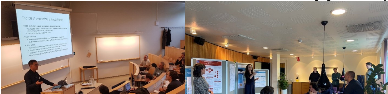
Bilder: ReNEW konferens och Emerging Scholars Day.