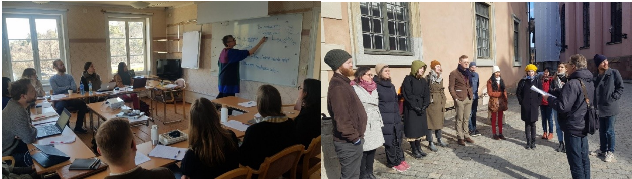
Bilder: Academic Writing Workshop och historisk rundvandring