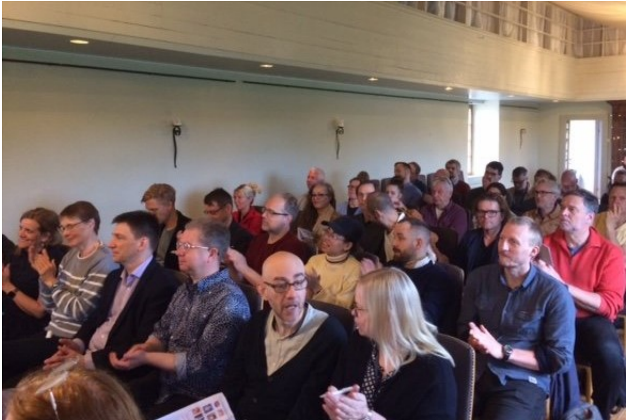
Bild: Tyresö historiedags stora publik.