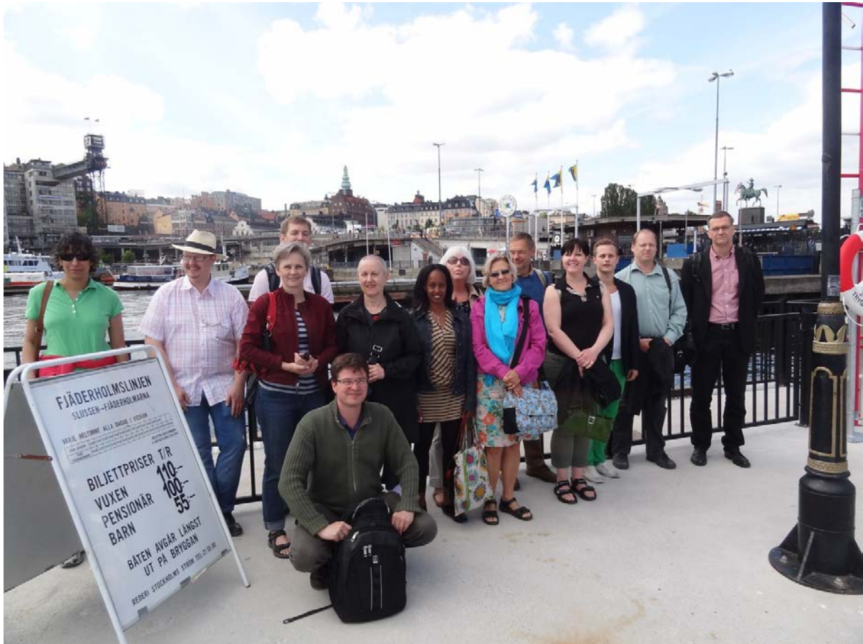
Samtidshistoriska institutets våravslutning med utfärd till Fjäderholmarna, 2012