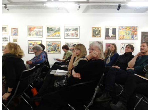
Fullsatt bland "strejkkonsten" i Tensta konsthall – konst som skänktes till gruvarbetarnas strejkkommitté vintern 1969-70.