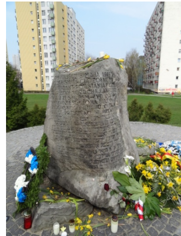
Vid en rest av ghattomuren. Från judiska begravningsplatsen samt minnessten över Mila 18, ghattorebellernas sista bunker.