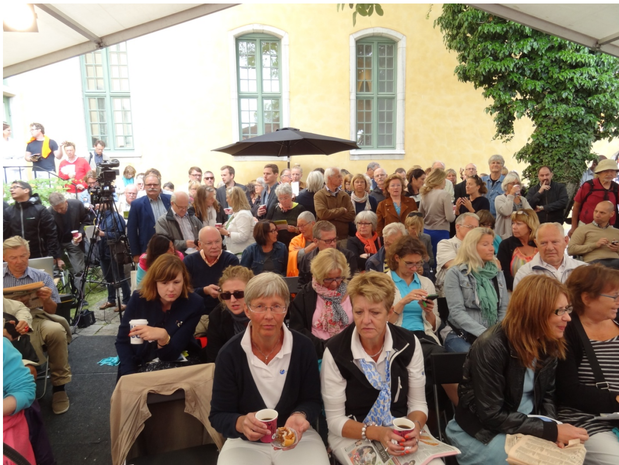
Fullt hus mötte Samtidshistoriska institutets vittnesseminarium i Almedalen när marknadsmekanismerna i vården diskuterades.

Samtidshistoriska institutet vid Södertörns högskola tillkom 1999, bara ett par år efter högskolans start. När detta skrivs förbereder sig institutet för sitt femtonårsjubileum till hösten 2014. Följande årsberättelse vill dock ge några glimtar från Samtidshistoriska institutets verksamhet under året 2013. Här återfinns lite av stort och smått, externt och internt, av framförallt det vi utträttat gemensamt. Härtill kommer förstås alla de insatser i forskning och undervisning som utförts av alla enskilda forskare, lärare och projektgrupper, varav långtifrån allt inrymts i denna berättelse.